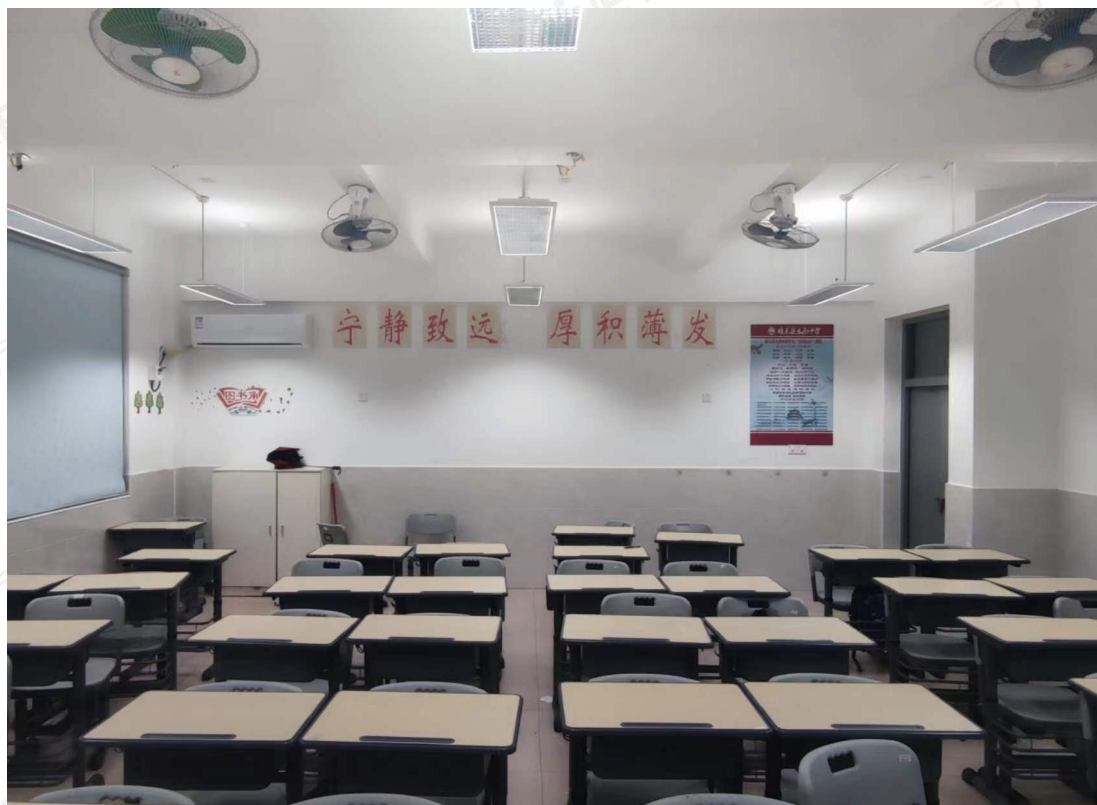
测试现场图（学习角方向）